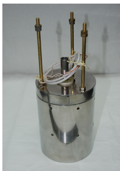
Рис. 2. Внешний вид соленоида

С целью повышения точности измерения распределения и однородности магнитного поля вдоль оси соленоида путем повышения стабильности поля во времени к выводам обмотки был подпаян сверхпроводниковый ключ. Кроме того, запитку соленоида током осуществляли с перемагничиванием сверхпроводниковой обмотки, которая заключается в наборе тока величиной