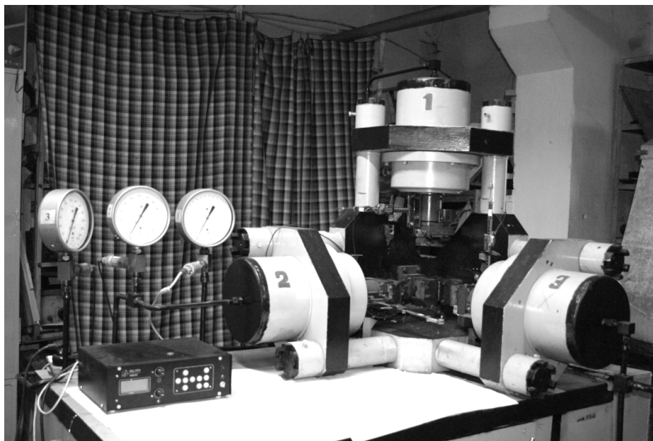
Рис. 1. Установка неравнокомпонентного трехосного сжатия

В соответствии с теорией, представленной выше, необходимо перейти к относительной плотности z = \rho_i/\rho_k , где \rho_i и \rho_k – плотность образца при данном значении давления одноосного нагружения и плотность матрицы угля (т.е. без пор):